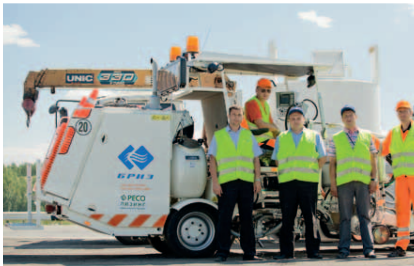
Использование современных технологий нанесения разметки термопластиком. 2011 год

У нашей компании есть свои традиции, свои корпоративные ценности, и, кроме того, а это очень важно, каждый сотрудник понимает, что мы работаем на общее благое дело – обеспечиваем безопасность на дорогах.