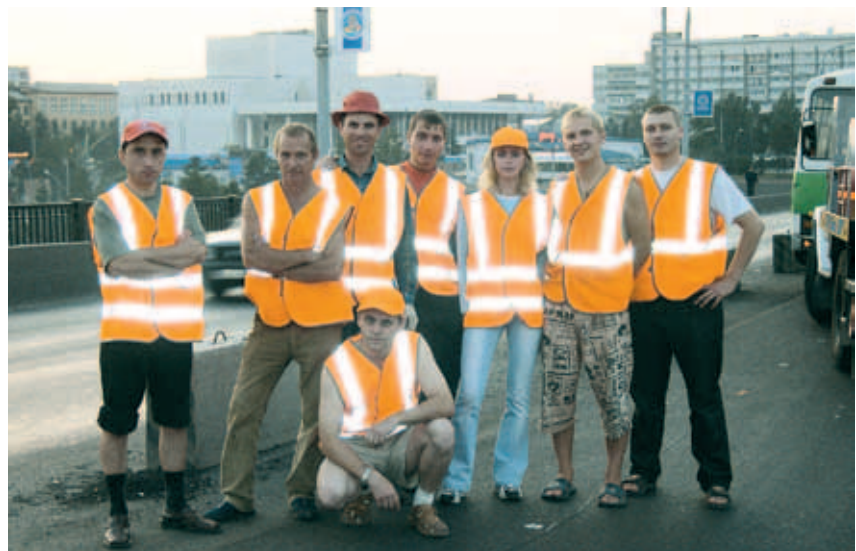
Последний день перед открытием Коммунального моста после ремонта. 2006 год