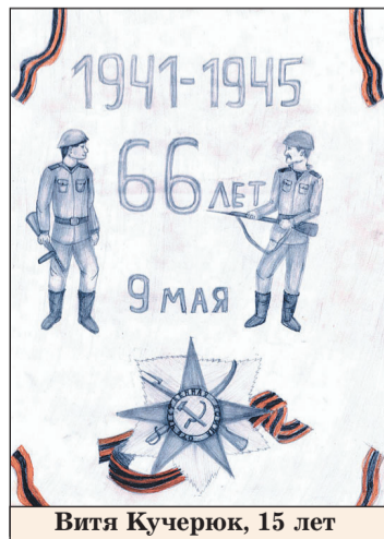
Витя Кучерюк, 15 лет

Об участниках конкурса и их рисунках – на стр. 7.