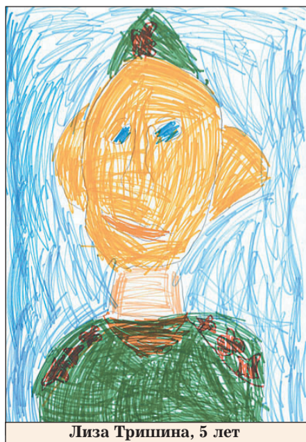
Лиза Тришина, 5 лет