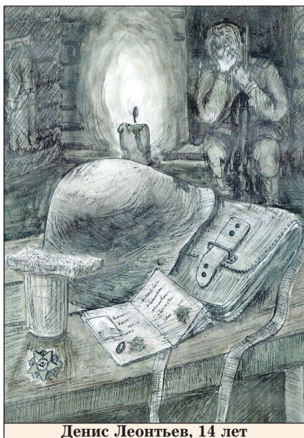
Денис Леонтьев, 14 лет